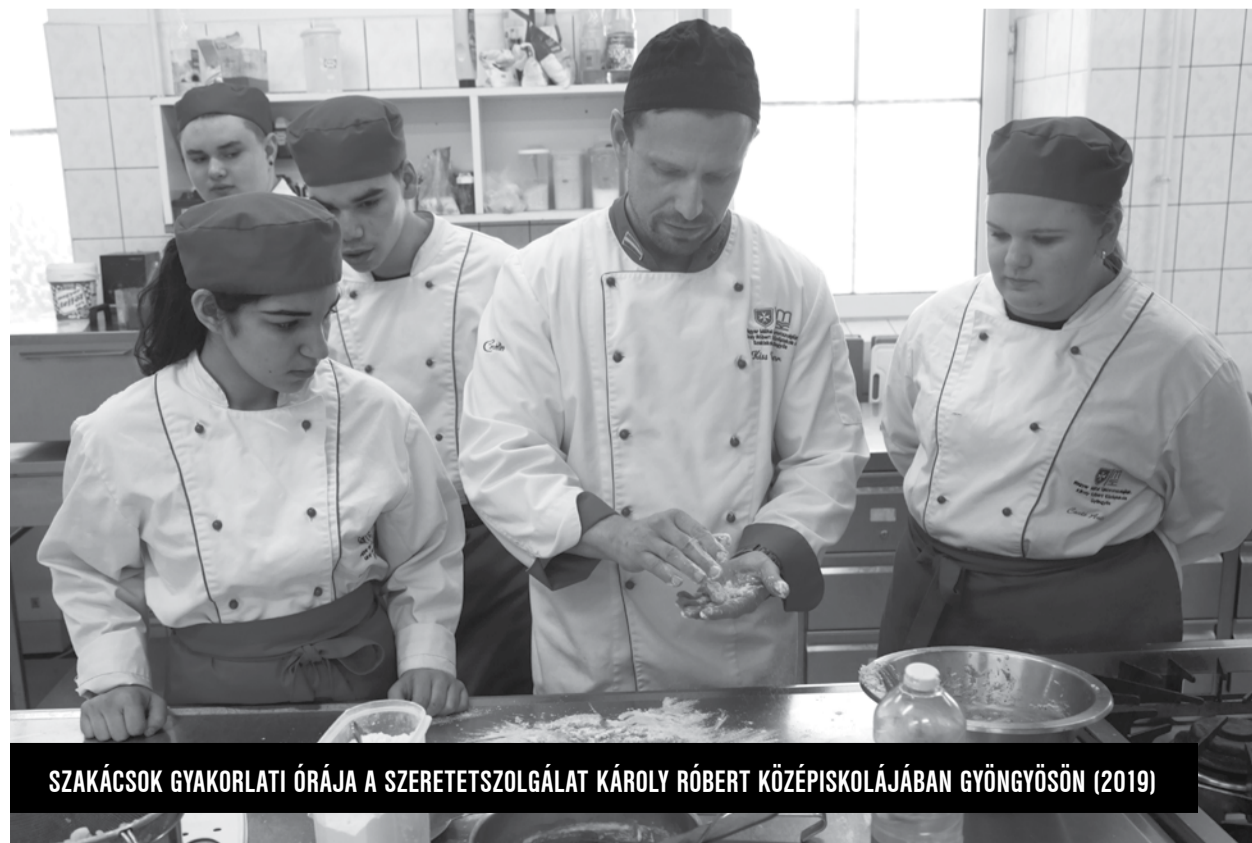
SAKÁCSOK GYAKORLATI ÓRÁJA A SZERETETSZOLGÁLAT KÁROLY RÓBERT KÖZÉPISKOLÁJÁBAN GYÖNGYÖSÖN (2019)