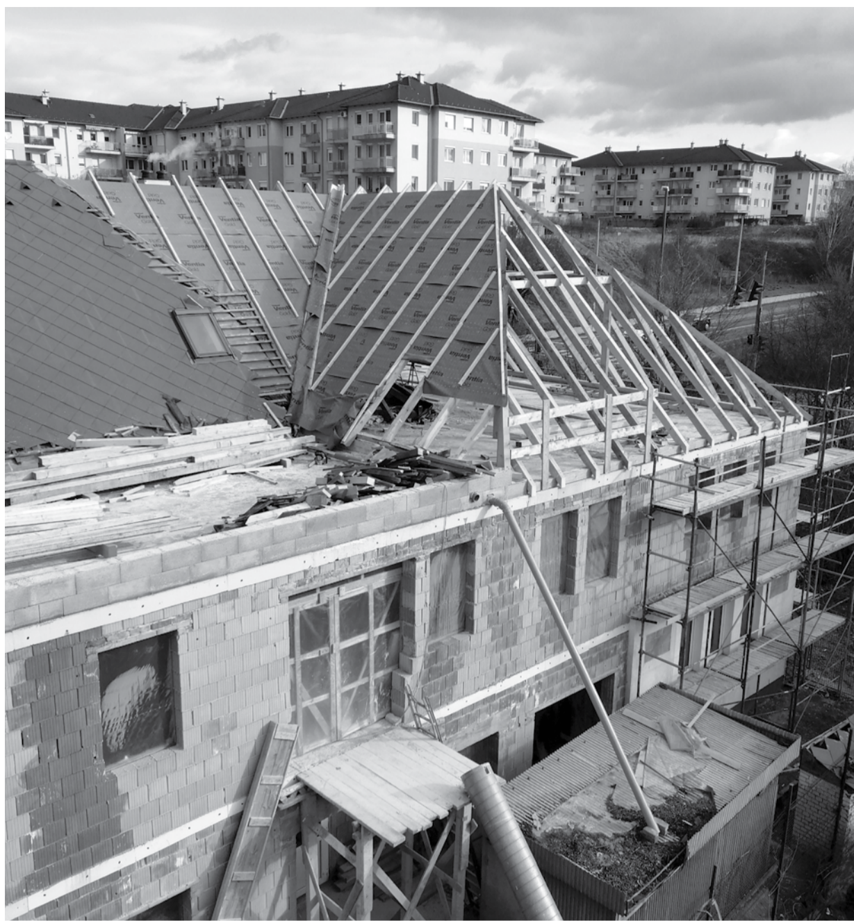
KÖZEL 200 MILLIÓ FORINTBÓL LIFTELT ÉS EGY ÚJ EMELETTEL BŐVÜL A BEFOGADÁS HÁZA

– Az éjjeli menedékhely, illetve az átmeneti szálló a hajléktalan ellátásban nagyon fontos feladatot tölt be. Általában a hajléktalan ember, amikor hozzánk fordul segítségért, vagy az utcai szolgálatunkkal először találkozik kint a közterületen, vagy bármilyen módon felveszi velünk a kapcsolatot, akkor általában ezek az egységek azok, ahol először helyet kap. Amikor egy ember belekerül ebbe az élettani krízishelyzetbe, hogy hajléktalanná válik, nagyon fontos, hogy nyugodt helyet tudjunk neki adni. Sokszor a hajléktalan ember, aki hozzánk fordul, idős, mozgásában korlátozottabb. A jelenlegi állapot szerint csak eme-