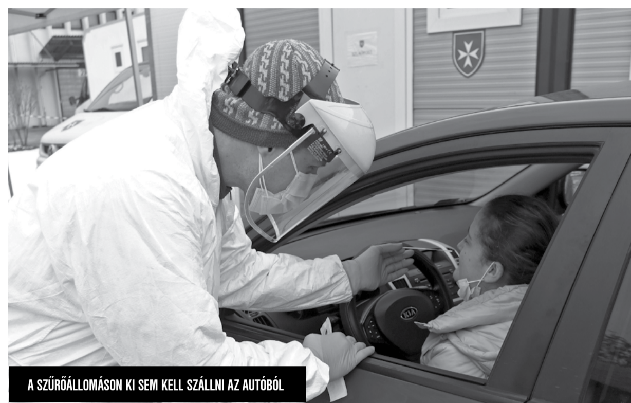
A SZÜRŐÁLLOMÁSON KI SEM KELL SZÁLLNI AZ AUTÓBÓL

– Az elején, alapvetően semmi más terv nem volt, mint hogy a saját gondozottjainkat, a saját munkatársakat tudjuk szűrni. Egyébként az első nagy szűrésünk, ahol közel 300 gondozottat és munkatársat kellett leszárnítani, az pont, ha jól emlékszem, március végén volt, tehát sajnos nem tudunk sokat ülni. De akkor még nem dolgoztunk az Országos Mentőszolgálattal, mert ugye, az első hullámnak nevezett időben