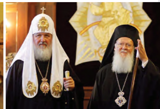
Kirill moszkvai pátriárka, valamint I. Bartholomaiosz konstantinápolyi pátriárka