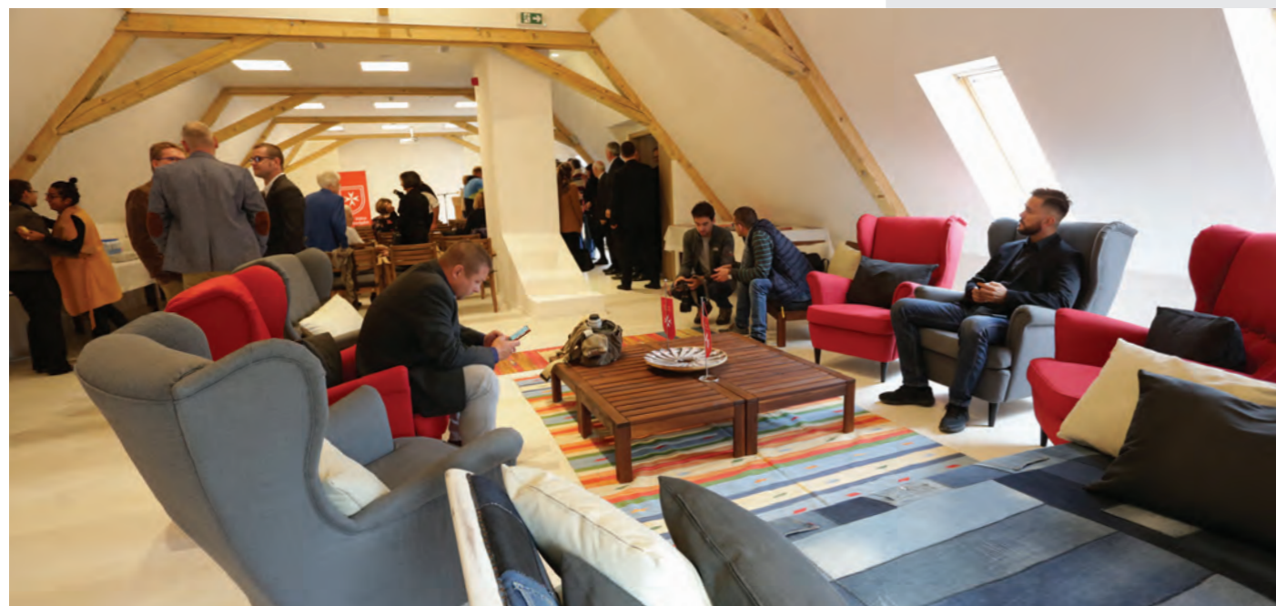
A pécsi régióközpont megújult tetőtere rendezvényeknek is otthont ad.

Csikó Zoltán, az Emmi egészségügyi fejlesztésekért felelős helyettes államtitkára arról beszélt, hogy a Szeretetszolgálat kérte az államtitkárság közbenjárását egy gyermekszemészeti vizsgálóegységhez, és ezért átalakítottak egy mammográfiaszűrőbuszt.