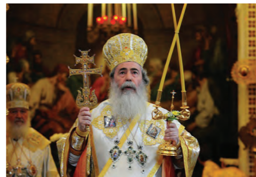
III. Theophilus jeruzsálemi görög ortodox pátriárka

Két bolgár egyházközség a budapesti parókus vezetése alatt. Főhatósága a szófiai patriarchátus.