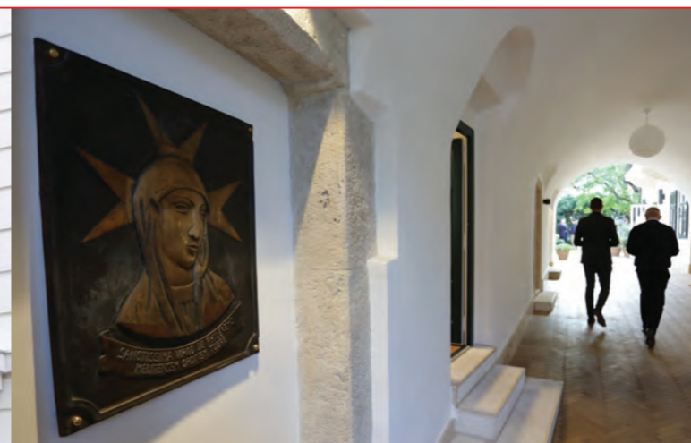
A Rend magyarországi hazatérése 1987-ben karitatív cselekedetekkel kezdődött, és 1996-ban a hivatalos bejegyzéssel zárult.