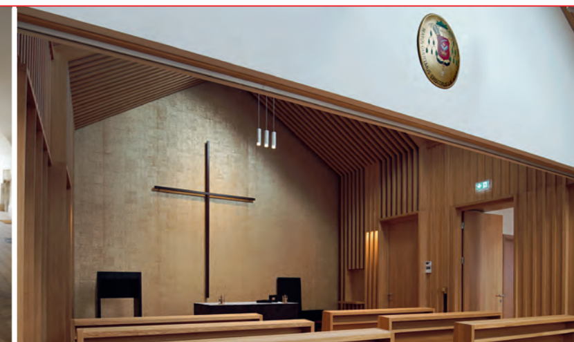
A tetőtérben nagyobb rendi kápolna és előadóterem létesült