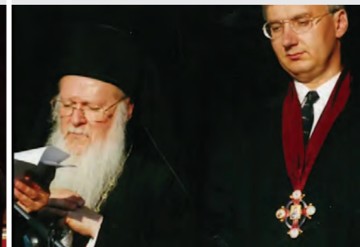
I. Bartholomaiosz pátriárka és Semjén Zsolt (2000)