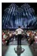
A címlapon: Szimfóniás gyerekek koncertje az Arénában (lásd 5. oldal)