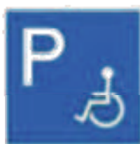
Akadálymentes tábla logója.

Akadálymentes parkoló kijelölése: Az épülethez a tervek szerint 1 db akadálymentes parkolóhely készül. A parkolóhely az akadálymentes bejárat közelében kerül kialakításra. Az akadálymentes gépjárműparkoló felület, ami 5,50 m hosszú és min. 3,6 m széles, táblával és burkolatfestéssel is jelölve lesz. A parkoló szilárd, egyenletes burkolatra kerül.